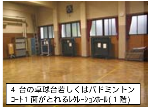
4台の卓球台若しくはバドミントンコート1面がとれるレクリエーションホール(1階)